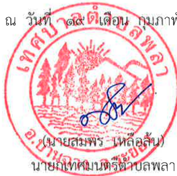
(นายสมพร เหลือสั้น) นายกเทศมนตรีตำบลพลา

ประกาศ ณ วันที่ ๑๙ เดือน กุมภาพันธ์ พ.ศ.๒๕๖๓