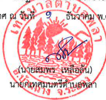
(นายสมพร เหลือสั้น) นายกเทศมนตรีตำบลพลา